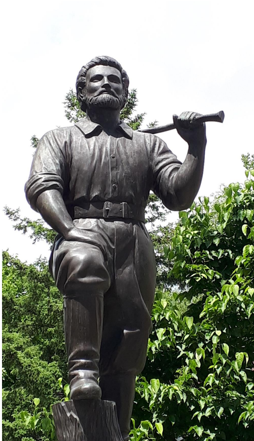
Monument représentant Guillaume Couture Situé près de l'église Saint-Joseph (Lévis)