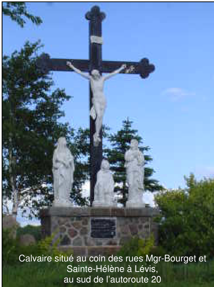
Calvaire situé au coin des rues Mgr-Bourget et Sainte-Hélène à Lévis, au sud de l'autoroute 20

Mgr Ignace Bourget, fils de Pierre et de Thérèse Paradis, deuxième évêque de Montréal, naquit dans une maison situé à quelques pas de là le 30 octobre 1799